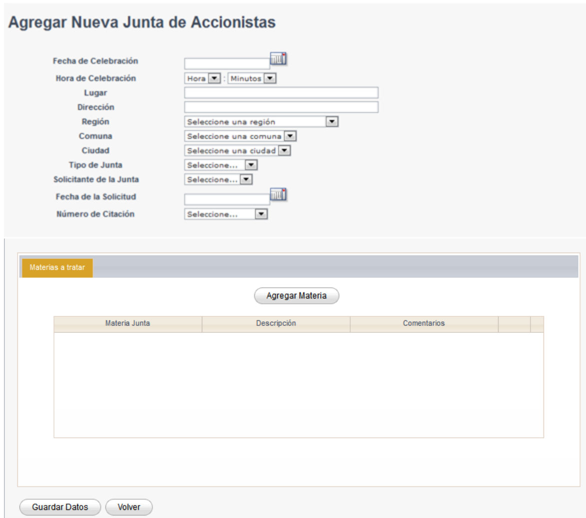
Fig 1. Agregar Información