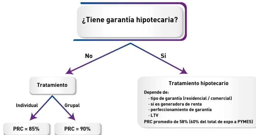
Gráfico: Tratamiento de PyMES en el estándar propuesto

Por lo tanto, un deudor PyME que postea una garantía hipotecaria por su crédito (que es el caso de casi dos tercios de las exposiciones de la banca en este segmento) obtendrá, bajo el modelo estándar, un PRC promedio de 58%. Si no cuenta con una garantía hipotecaria y es clasificado grupalmente, entonces tendrá tratamiento grupal con un PRC de 90%. Se asignará en cartera grupal, si posee productos simples, su exposición agregada es inferior a 20.000 UF y representa menos de 0.2% del total. Por último, si la PyME es clasificada individualmente, el PRC será de 85%. Bajo la norma vigente, el PRC es 100%.